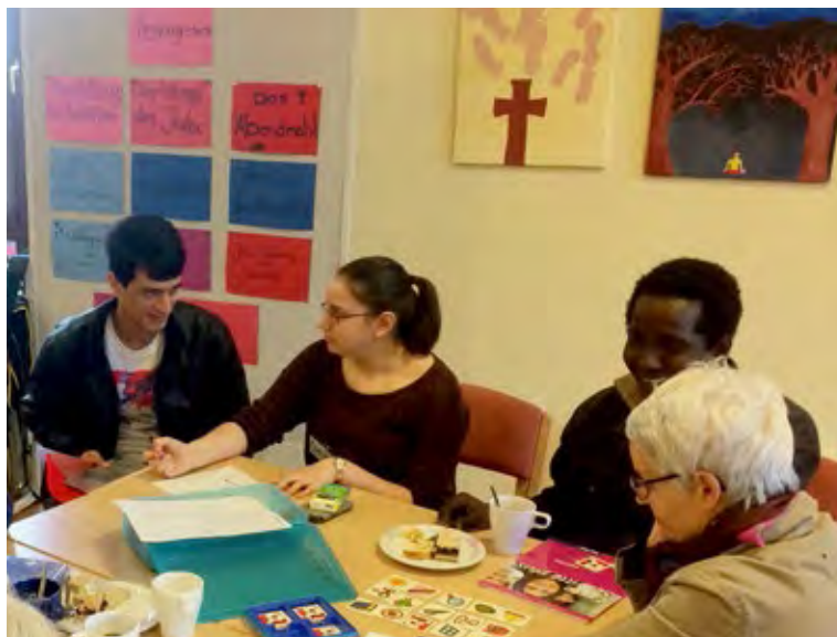
Deutschlern mit verschiedenen kreativen Methoden und Hilfsmitteln.

Aktionen wie diese fördern das Kennenlernen und das Aufeinander zugehen. Der „fremde Flüchtling“ wird nicht mehr als anonyme Bedrohung gesehen, sondern mehr und mehr als Mitmensch,