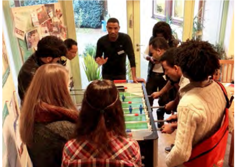
Kickerturnier im Internationalen Café in Winsen an der Luhe.

um Familienangehörige in der Heimat, um ihr Land, um ihre Zukunft in Deutschland.