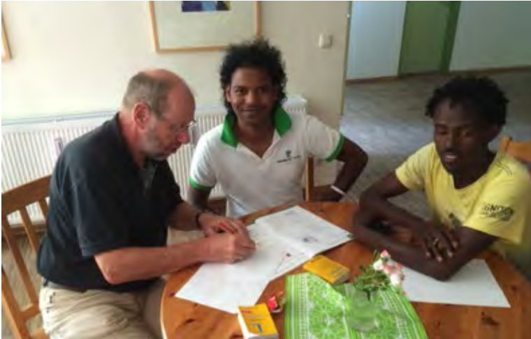
Hilfe bei den ersten Schritten in der deutschen Sprache im Internationalen Café in Winsen an der Luhe.