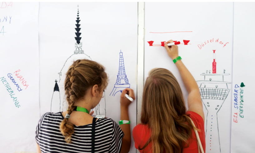
Global Schools Day in Wittenberg am 23.06.2017.

Wer, wie, was – wieso, weshalb, warum? Unzählige Fragen begegnen uns Menschen im Laufe unseres Lebens. Die Evangelische Kirche fördert lebenslanges Lernen auf allen Ebenen – vom Kleinkind bis zum Erwachsenen im hohen Alter. Als einer der größten Bildungsanbieter übernimmt sie in der Gesellschaft und ihren Kirchengemeinden Bildungsverantwortung als Trägerin von Kindertagesstätten, Schulen, Hochschulen, Akademien und