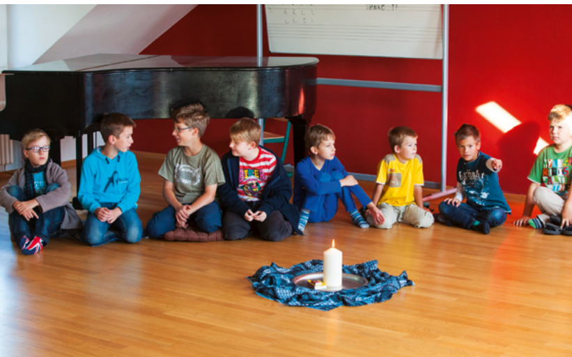
Kinder der Evangelischen Grundschule Schwedt feiern Andacht.

* Quelle: Statistik der Kinder- und Jugendhilfe am 01.03.2017 des Statistischen Bundesamtes.